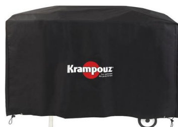
Housse pour Chariot Plein Air (Ref. AHC1)**