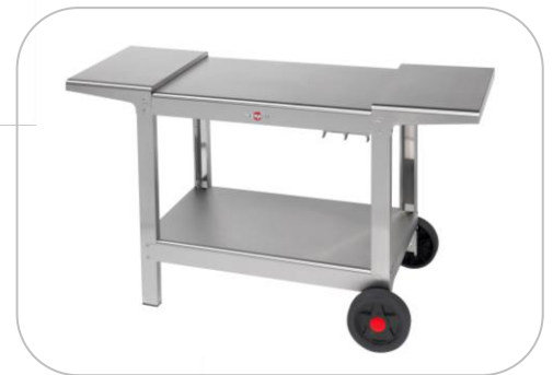
Chariot PLEIN AIR / Cart PLEIN AIR