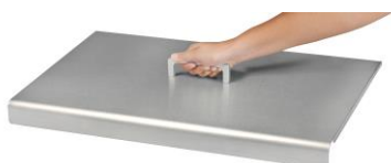
Capot pour plancha Design simple (Ref. ACP6)