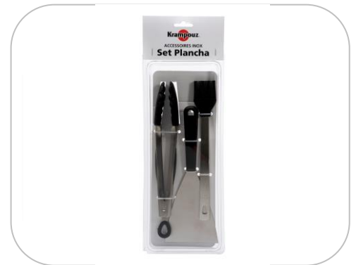
Set accessoires Plancha / Set accessories for plancha