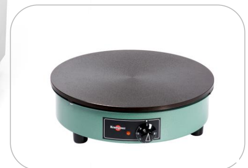
Crêpière BILLIG / Electric crepe maker BILLIG