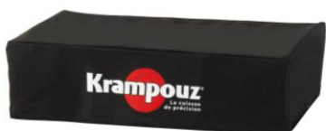
Housse pour plancha Design double (Ref. AHP2)