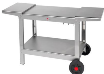
Chariot Plein Air pour plancha Design double (Ref. KHEA05)*