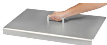
Capot pour plancha Design double (Ref. ACP5)